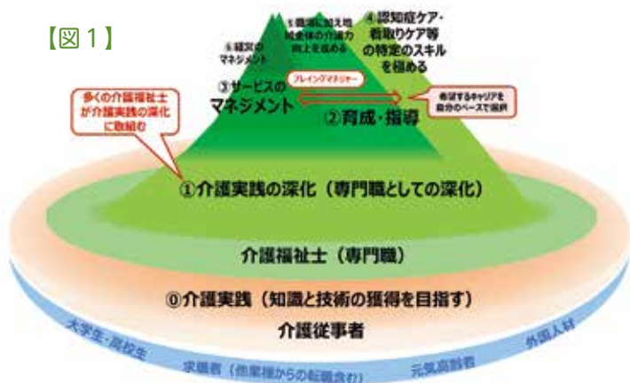
【図1】厚生労働省「第1回介護福祉士国家試験パート合格の導入に関する検討会」参考資料1-1より抜粋。

「人材別に見た働くうえでの課題・制約と必要な配慮」を公表しています。このように、多様な人材が介護分野で働き続けられるような取組みが本格化しています。